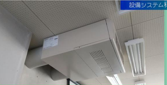
有効な換気と省エネルギーを両立する空調換気扇